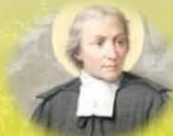
St Jean-Baptiste de La Salle