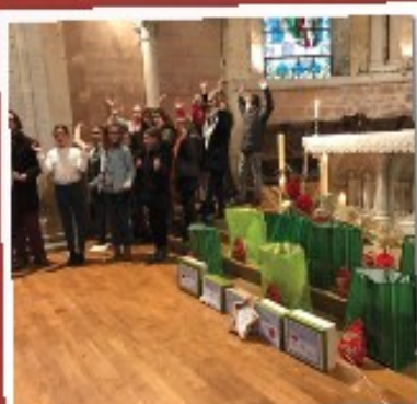
DONNER DE LA JOIE

Une occasion pour nous tous de découvrir le quotidien et les parcours de ces blessés de la vie, de revoir la copie de nos a priori sur les sans-abris et en janvier de rencontrer le SDAT de Dijon. Nous vous partageons en images la joie de cet élan de générosité partagée ... et souhaitons à chacun de découvrir chaque jour un peu plus la joie de donner, d'aimer et d'être aimé.