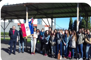
Visite aux archives départementales p 14