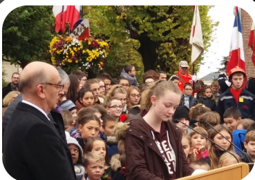
Devoir de mémoire p 7