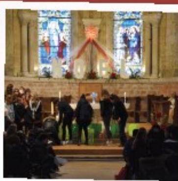
PARTAGER CE QUE L'ON A