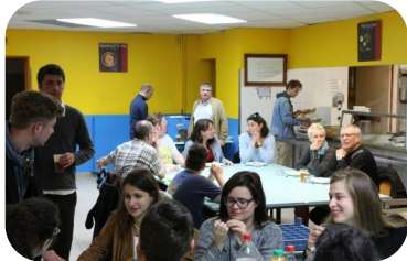
Fête de St Jean Baptiste de La Salle p 5