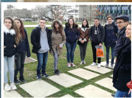
P. O. à l'Université p 7