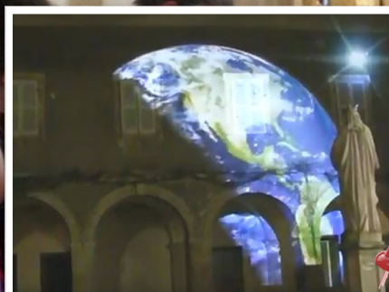
Création numérique p 21