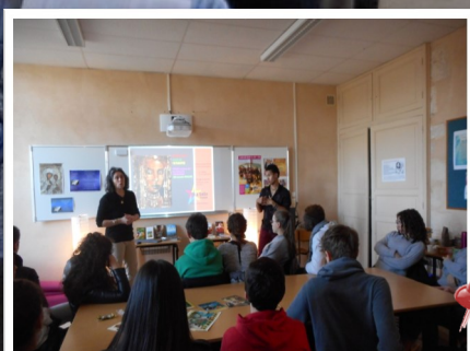
EDDE - ETHIOPIE p 33-34